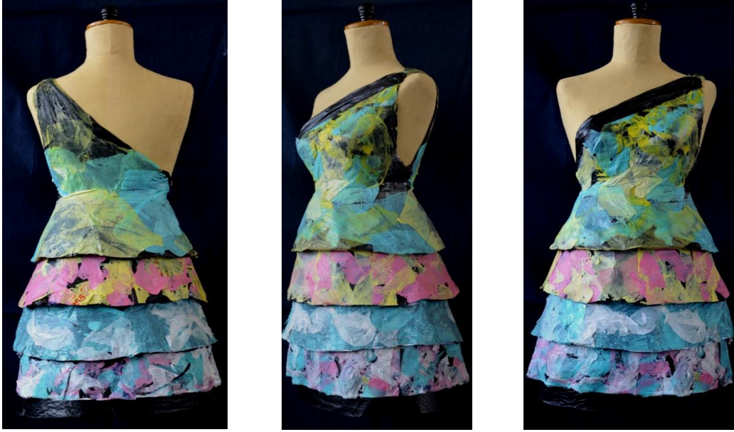
شكل (16) التصميم السادس من الأمام والخلف والجنب