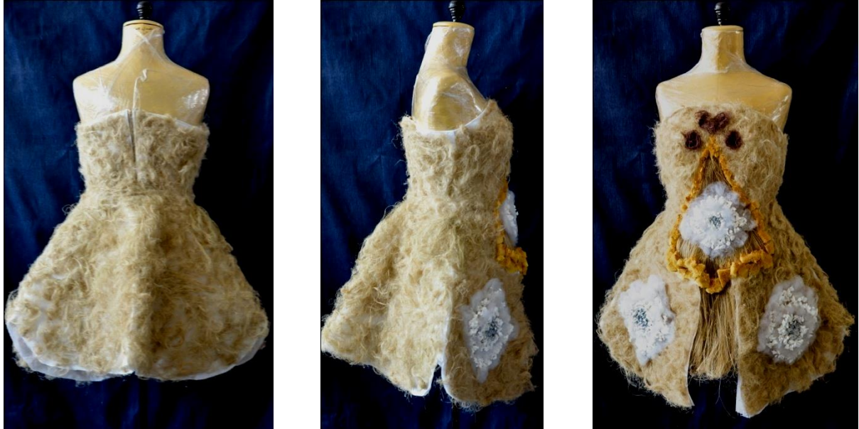
شكل (12) التصميم الرابع من الأمام والخلف والجنب

الفستان الأساسي تم حياكته، أما الأجزاء الزخرفية فقد تم تثبيت قطع القطن والفلين الصغيرة بالشمع السائل حتى يجف، وتم تثبيت ألياف الكتان والخيوط القطنية والاسفنج بالغراء الأبيض وزخرفتها بالجليتز الذهبي بالرسم المباشر .