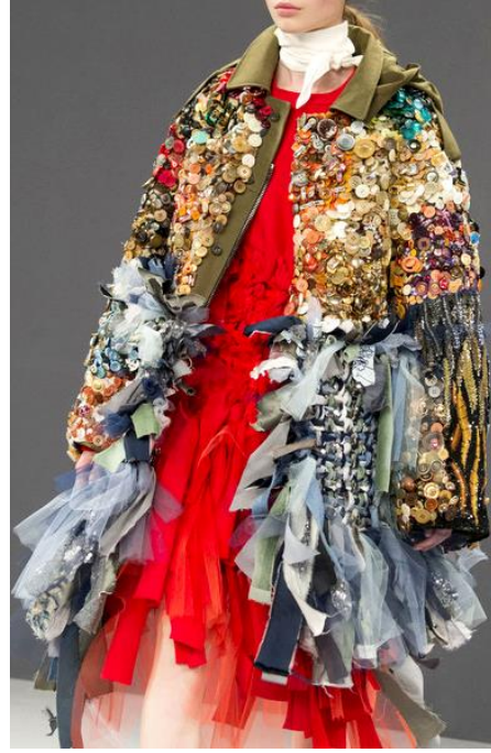
شكل (1) تصميم لفكتور أند رالف