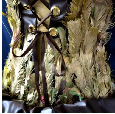
شكل (21) خامات التصميم الثامن