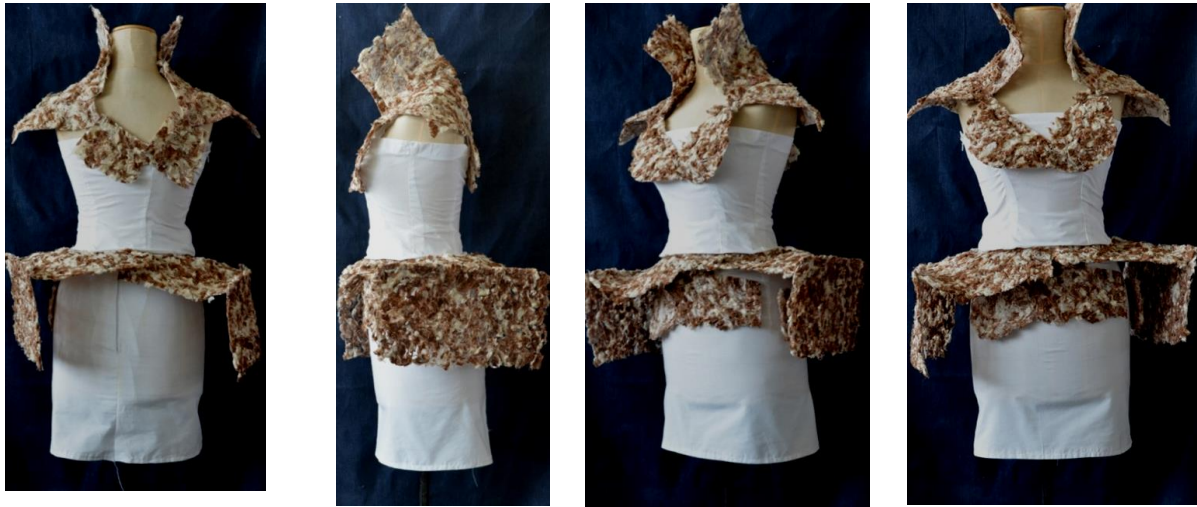
شكل (6) التصميم الثاني من الأمام والخلف والجانبين

حياكة للفستان الأساسي، تنسيل قماش لتحويله إلى شعيرات، تنشية الشعيرات بالغراء والماء لجعلها صلبة شكل (8) وفردتها على هيئة قطع قماش وتترك لتجف ثم تشكل حسب التصميم المطلوب شكل (9) وتثبت قطع القماش التي تم تنفيذه على الفستان بالحياكة، مع تثبيت جزء منها في الجزء السفلي من الفستان بوضع دعامات من الحديد لتثبيتها وجعلها قائمة وتشكيلها بالشكل المطلوب .