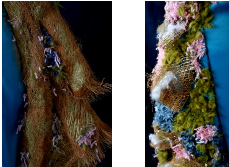
شكل (5) الخامات المستخدمة في التصميم الأول