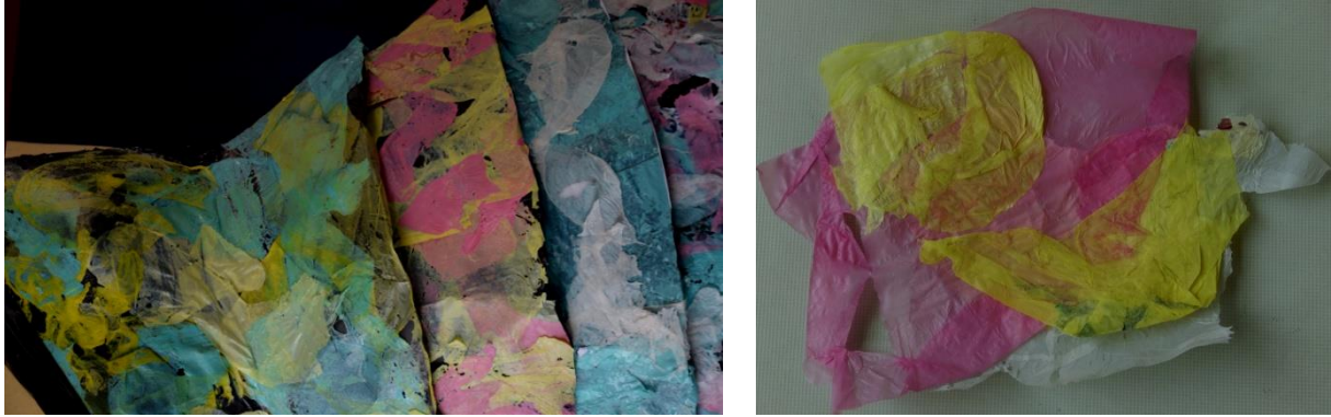
شكل (17) الخامات المستخدمة في التصميم السادس