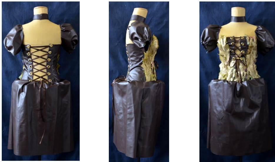
شكل (20) التصميم الثامن من الأمام والخلف والجنب

حياكة الفستان الجلدي، رش الريش بالسبراي الذهبي وتثبيتته على الفستان، وتثبيت الحلقات المعدنية على الجلد، ثم تدليك أشرطة الستان فيها بشكل متقاطع، كشكشة الجلد عند الأكمام والوسط ليعطي الشكل المنتفخ، شكل (21) .