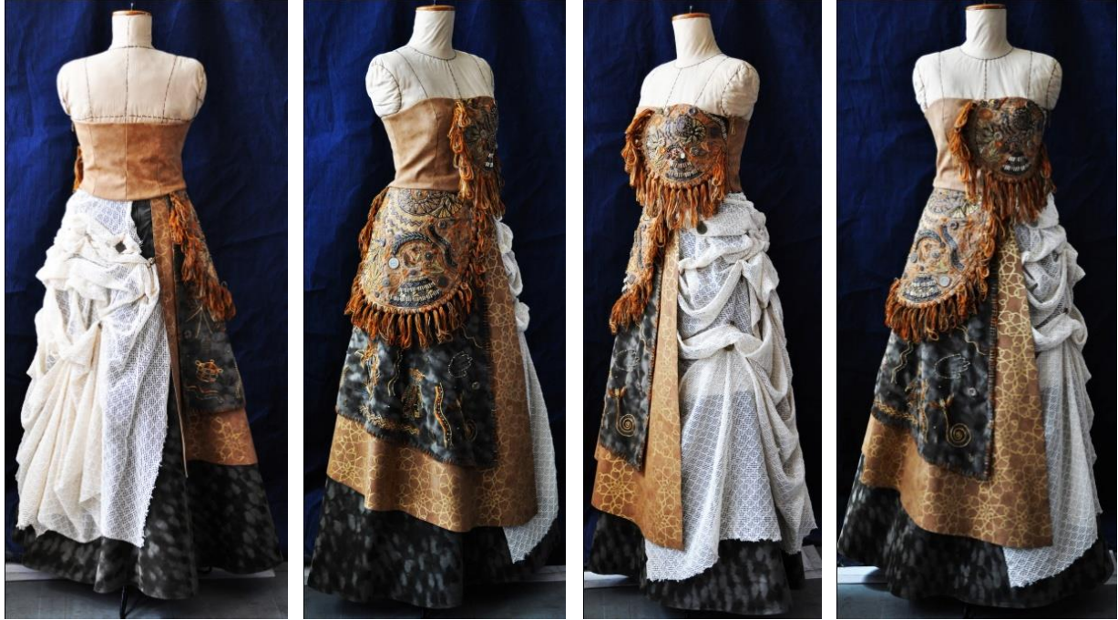
شكل (10) التصميم الثالث من الأمام والخلف والجانبين

حياكة طبقات الفستان المترامية، تطريز بالخيوط والخرز والمعادن، ورسم بالريليف على الجلود، ورسم مباشر على الشمواه والجلود، ودرابيها وكشكشة وتجميع، وحياكة يدوية على أطراف الشمواه، وخيامية وإضافة أقمشة "Patchwork" ويظهر ذلك بوضوح في شكل (11) .