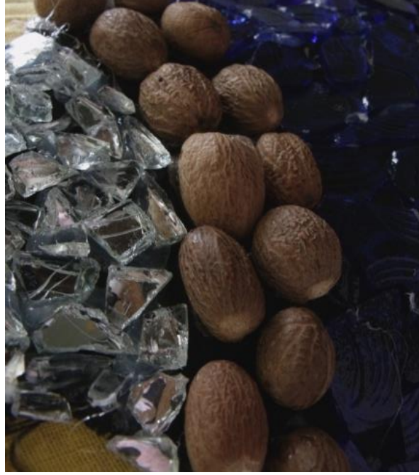
شكل (23) الخامات المستخدمة في التصميم