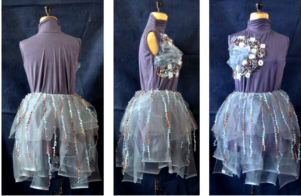
شكل (24) التصميم العاشر من الأمام والخلف والجنب