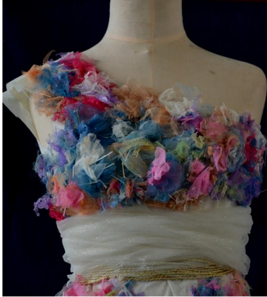
شكل (15) الخامات المستخدمة في التصميم الخامس

تم حياكة الفستان وتثبيت طبقات من الأقمشة المختلفة متراكبة فوق بعضها في مناطق وطبقة واحدة في مناطق أخرى لتعطي الشفافية في مناطق من التصميم، وتم زخرفة الفستان بأقمشة مضافة متعددة الألوان ومجمعة ومثبتة بشكل دائري يعطي إحياء بالورود، وتم عمل درابيه دائري عند منطقة الوسط وتثبيته بحبال ملتفة من السيرما على الوسط .