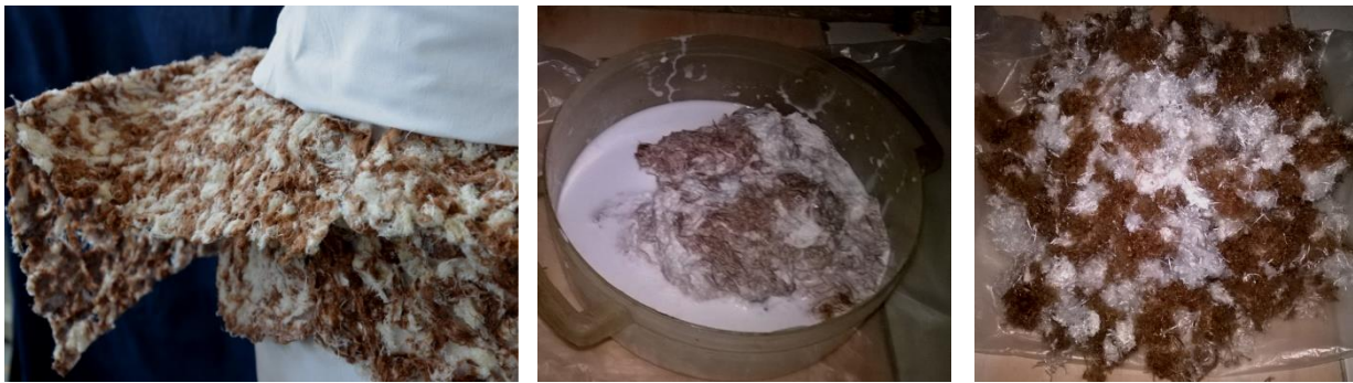
شكل (9) الخيوط مثبتة على الفستان