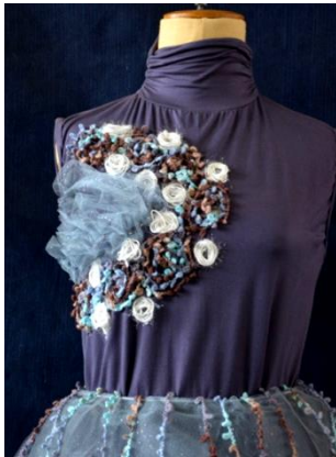
شكل (26) الخامات مثبتة على التصميم