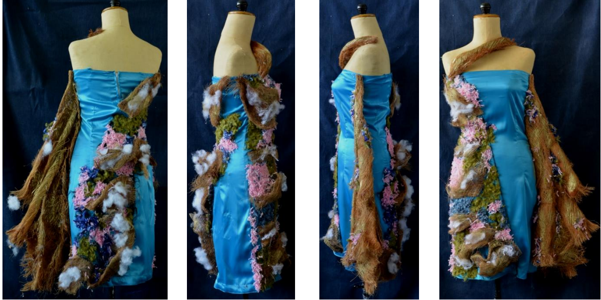
شكل (4) التصميم الأول من الأمام والخلف والجانبين

الحياكة للفستان الأساسي، مع إضافة للخياطة وزعف النخيل بالحياكة والتطريز واللصق، وبرم وتضفير لزعف النخيل في بعض المناطق .