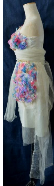
شكل (14) التصميم الخامس من الأمام والجنب