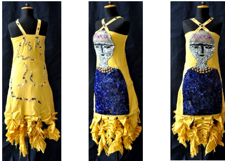
شكل (22) التصميم التاسع من الأمام والخلف والجنب

الحياسة للفستان، وتثبيت قطع الزجاج والمرايا المهمشة وأعواد الكبريت والقطع الخشبية على الفستان باللصق، وكشكشة الأشرطة في الذيل مع ترك أطرافها منسلة، وتم حشو طاقية الطفل بالفبير لتأخذ شكل بارز، إضافة أقمشة أخرى (خيامية) "Patchwork" ويظهر ذلك في شكل (23) .