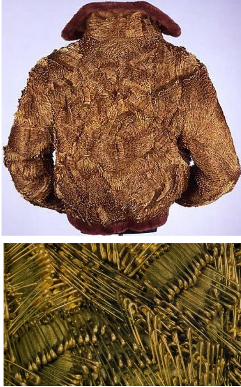
شكل (2) جاكيت لمارك ماهايل