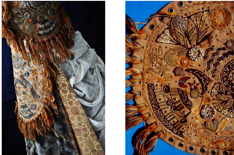
شكل (11) الخامات المستخدمة في التصميم الثالث