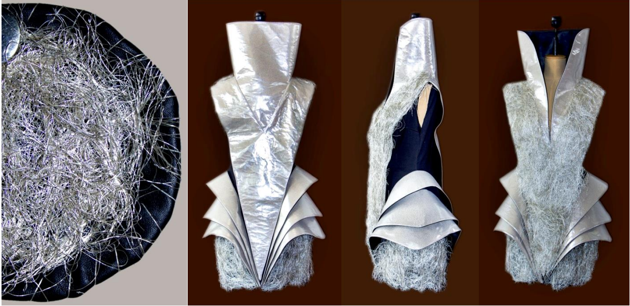
شكل (18) التصميم السابع من الأمام والخلف والجنب